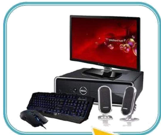
Computadora con CPU Horizontal