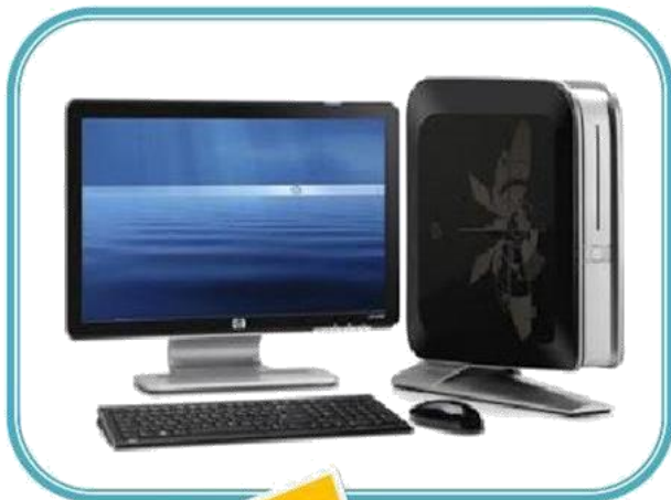
Computadora con CPU Vertical

Tienen dos modelos que les mostramos a continuación: