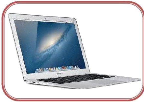
Laptop Notebook y Netbook

Son más livianas y pequeñas, se pueden llevar con facilidad a cualquier lugar. A este grupo pertenecen: