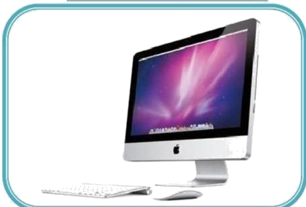
Computadora AIO ALL IN ONE (Todo en uno)