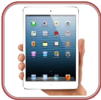
Ipad o Tablet